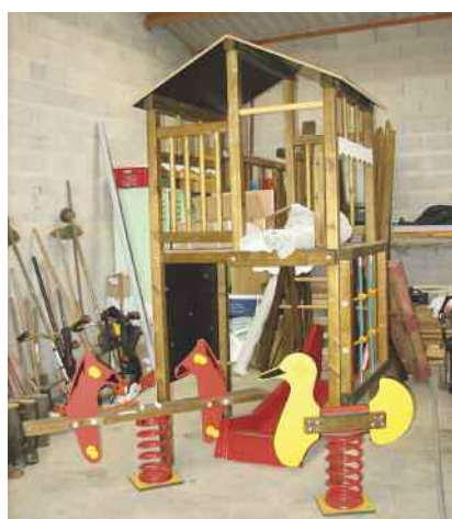
Ces jeux pour enfants seront prochainement installés sur le stade

Livrés depuis quelques semaines, les jeux pour les enfants vont être installés pour les beaux jours. La volonté de la Municipalité de créer un parc sur le stade arrive à terme. Ainsi pendant que les grands joueront au ping-pong ou à la pétanque, les petits profiteront d'un portique avec balançoire,