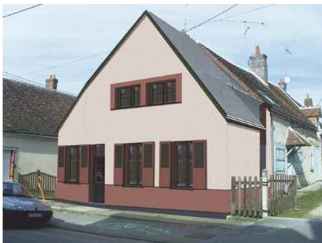
L'une des maisons acquises par la municipalité rue Jean-Moulin : état projeté après rénovation

Suite à l'acquisition de deux maisons de la rue Jean-Moulin, la municipalité vient de déposer le permis de construire autorisant leur aménagement et leur réhabilitation en trois logements à loyers modérés. Le projet de l'architecte a été retenu et les travaux devraient commencer en début d'année 2011 comme prévu. Le réaménagement comprend la réalisation d'une isolation thermique performante (toiture, mur, menuiserie), la mise aux normes (sécurité, électricité, sanitaires), l'aménagement intérieur respectant l'accessibilité des lieux aux personnes à mobilité réduite, le tout avec la volonté de valoriser le patrimoine communal.