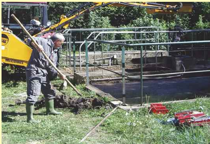
Des travaux ont dû de nouveau être entrepris dans la station d'épuration sur une pale cassée

Nous vous l'avions déjà rappelé dans le numéro de fin d'année 2009, une grande partie des habitations de la commune est reliée au tout-à-l'égout et la station d'épuration permet le traitement des eaux usées. En octobre dernier, le système d'hélice avait dû être totalement nettoyé car bloqué à cause de déchets importants. Cette fois, c'est une pale de l'agitateur de la station qui a cassé. La pale a été réparée mais nous vous rappelons que de nombreux résidus de lingettes, serpillères et autres déchets sont retrouvés régulièrement malgré le filtrage. Il est important que chacun prenne conscience que ce genre de désagréments engendre sur du long terme de nombreux investissements qui peuvent être évités si chacun se sent concerné.