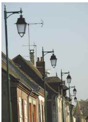
18 nouveaux candélabres ont été installés dans rues de Bel Air, Jean-Moulin et du Stade

Les travaux d'enfouissement de réseaux dans les rues de Bel-Air, Jean-Moulin et du Stade sont terminés. De nouveaux candélabres sont apparus sur ces voies. Esthétiques, ils sont aussi économiques puisque la puissance change automatiquement de 150 à 100 watts à partir d'une certaine heure. Même principe pour les doubles candélabres avec lanterne en haut et en bas dont la puissance varie entre 100 et 70 watts.